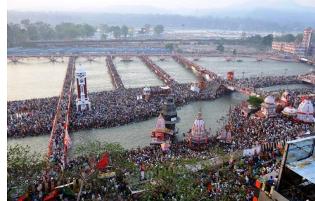
Маха Кумбх Мела