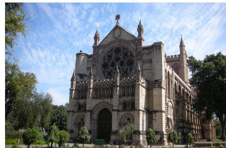
Собор всех святых